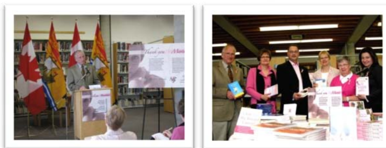
Lancement de la collection le 8 mai 2009